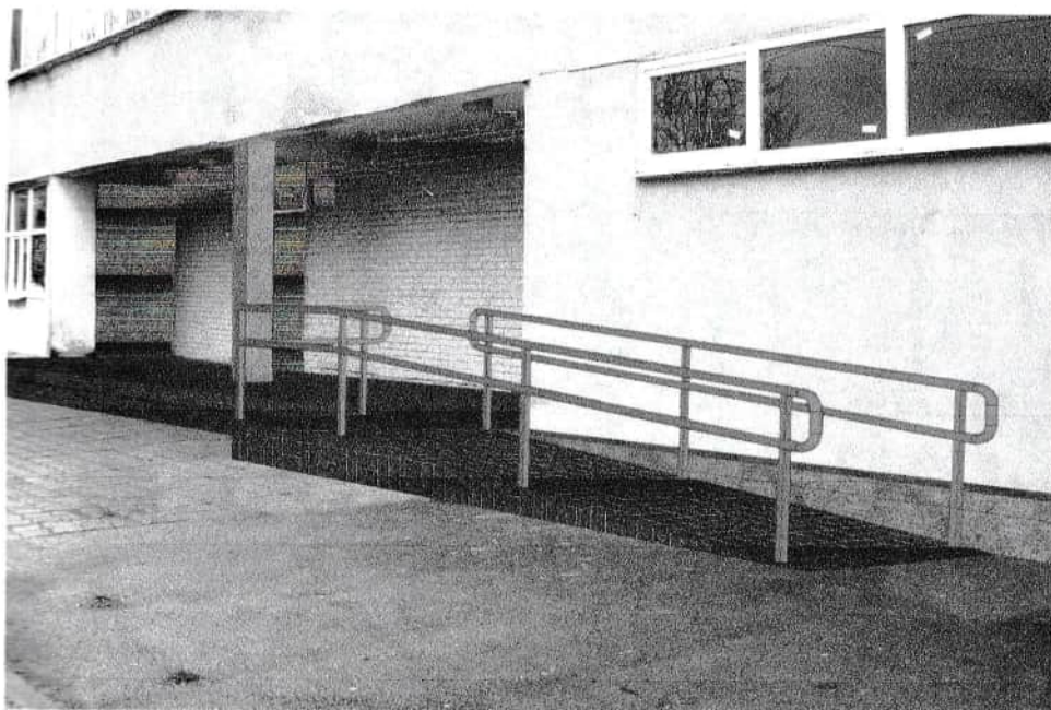
Загальний вигляд пандусу

Відповідно до програми обстеження виконані роботи з фотофіксації елементів пандусу.